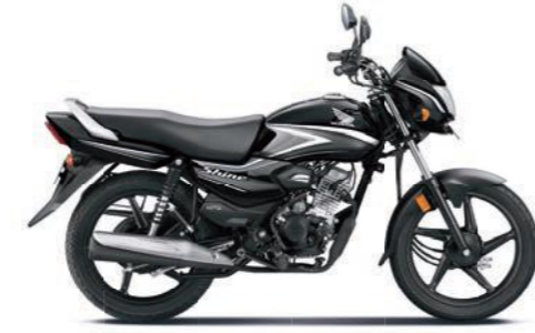
ग्रे के साथ ब्लैक

अभी ऑनलाइन बुक करें! www.honda2wheelerindia.com