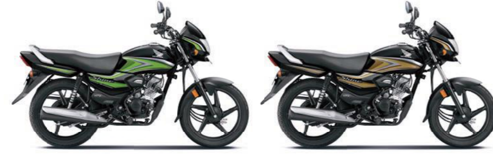
ग्रीन के साथ ब्लैक गोल्ड के साथ ब्लैक